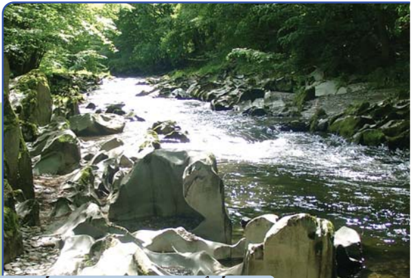
Dem Fluss des Wassers folgen

Wie überall im Thüringer Wald war das Leben der Menschen in der Vergangenheit nicht gerade einfach. Vielfältige Anstrengungen waren erforderlich, um den Bergen ihre Bodenschätze zu entreißen, das Holz der Berghänge zu nutzen und auch Ackerbau und Viehzucht zu betreiben. Mit Fleiß und Einfallsreichtum haben sich die Bewohner der Region immer wieder den sich ständig verändernden Bedingungen angepasst und Metallhandwerk, Glas- und Porzellanherstellung in der Region zu wahrer Meisterschaft entwickelt. Eine besondere technische Leistung zieht jährlich tausende Touristen an, die Oberweißbacher Bergbahn. Sie wurde 1919 - 1923 als Standselbahn zwischen den Orten Obsfelder Schmiede, im Tal an der Schwarza, und Lichtenhain, auf der Höhe der Berge, errichtet. Aber auch in unseren Tagen sind in der Region technische Spitzenleistungen entstanden bzw. im Entstehen begriffen. So zum Beispiel der Staudamm der Trinkwassertalsperre Lichte-Leibis, der eine Höhe von 102,5 m ausweist und 2006 fertig gestellt wurde. Der Staudamm ist damit einer der höchsten in Deutschland. Zu den Spitzenleistungen gehört aber auch das Pumpspeicherwerk Goldisthal mit seinen Ober- und Unterbecken und den technischen Anlagen zur Stromerzeugung im Rotseifenberg. Im Entstehen ist die ICE-Strecke zwischen Erfurt und Nürnberg. Dort wo sich bis vor 150 Jahren noch Fuhrgespanne über die Handelswege zwischen Nord und Süd den Bergen empor quälen mussten, werden sich bald kühne Brücken über die Flusstäler spannen.