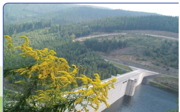
Über handwerkliches Geschick und technische Leistungen staunen

Wie überall im Thüringer Wald war das Leben der Menschen in der Vergangenheit nicht gerade einfach. Vielfältige Anstrengungen waren erforderlich, um den Bergen ihre Bodenschätze zu entreißen, das Holz der Berghänge zu nutzen und auch Ackerbau und Viehzucht zu betreiben. Mit Fleiß und Einfallsreichtum haben sich die Bewohner der Region immer wieder den sich ständig verändernden Bedingungen angepasst und Metallhandwerk, Glas- und Porzellanherstellung in der Region zu wahrer Meisterschaft entwickelt. Eine besondere technische Leistung zieht jährlich tausende Touristen an, die Oberweißbacher Bergbahn. Sie wurde 1919 - 1923 als Standselbahn zwischen den Orten Obsfelder Schmiede, im Tal an der Schwarza, und Lichtenhain, auf der Höhe der Berge, errichtet. Aber auch in unseren Tagen sind in der Region technische Spitzenleistungen entstanden bzw. im Entstehen begriffen. So zum Beispiel der Staudamm der Trinkwassertalsperre Lichte-Leibis, der eine Höhe von 102,5 m ausweist und 2006 fertig gestellt wurde. Der Staudamm ist damit einer der höchsten in Deutschland. Zu den Spitzenleistungen gehört aber auch das Pumpspeicherwerk Goldisthal mit seinen Ober- und Unterbecken und den technischen Anlagen zur Stromerzeugung im Rotseifenberg. Im Entstehen ist die ICE-Strecke zwischen Erfurt und Nürnberg. Dort wo sich bis vor 150 Jahren noch Fuhrgespanne über die Handelswege zwischen Nord und Süd den Bergen empor quälen mussten, werden sich bald kühne Brücken über die Flusstäler spannen.