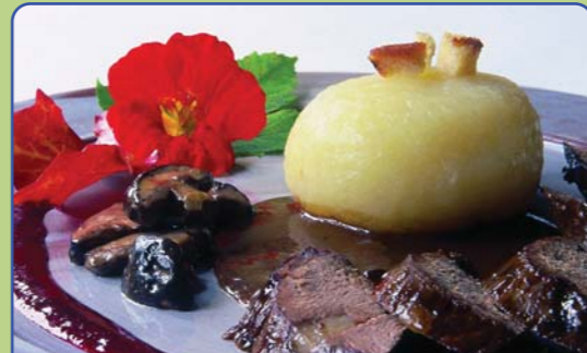
Thüringer Gastlichkeit erfahren

Die Schwarza gilt als goldreichster Fluss Deutschlands. Im Verlaufe der Jahrhunderte wurden im Schwarzatal ca. vier Tonnen Gold aus dem Kies des Flusses gewaschen oder aber bergmännisch aus den vorhandenen Quarzgängen abgebaut. Besondere Fundorte waren Sitzendorf, Katzhütte und Goldisthal. Zahlreiche Goldwaschplätze und Abbauorte aus jener Zeit sind heute noch am Fluss und in seiner Nähe auszumachen. Im 18. Jahrhundert wurde die Goldgewinnung im Schwarzatal eingestellt, aber mit jedem Fund eines Nuggets flammte das Goldfeber immer wieder auf. In verschiedenen Gemeinden kann man auch heute noch - im Rahmen von Veranstaltungen - das Goldwaschen erleben.