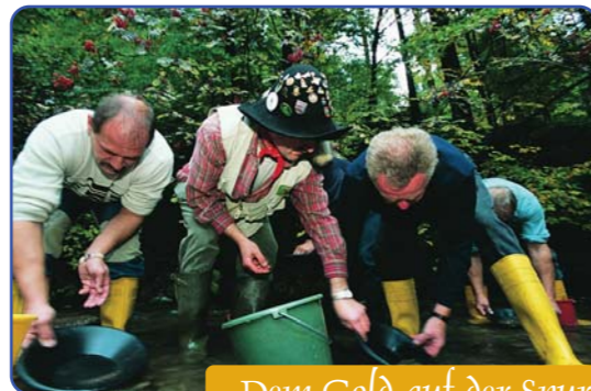
Dem Gold auf der Spur

belassenen bzw. Natur nahen Wegen. Asphalt und Beton wurden, wo möglich, vermieden. Schon 1838 schwärmte der Reisende Ludwig Bechstein „Es gibt Landschaften, die man mit einem Blick festzaubern möchte in den Spiegel unvergänglicher Erinnerung, bei deren Anblick man weder in Nähe noch Ferne auch das mindeste vermisst.“ Auch der Wanderer, ob sportlich aktiv oder Landschaft und Natur genießend, beschaulich unterwegs, wird nichts vermissen. „Wer vieles bringt, wird manchem etwas bringen“. Landschaft, Natur, Kultur und die Gastgeber der Region bieten dem Wanderer viel Erlebnenswertes. Zu jeder Jahreszeit hat der Weg ein anderes Gesicht und es lässt sich kaum sagen, wann es am schönsten ist.