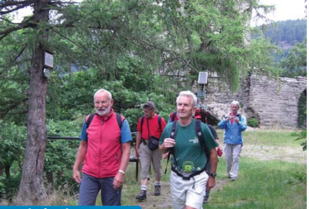
Sportlich aktiv sein

Mit einer Länge von 135 km und je knapp 4.000 Höhenmeter in der Addition aller An- und Abstiege stellt der Panoramaweg eine durchaus sportliche Herausforderung für junge und jung gebliebene Wanderer dar. Sein sportliches Plus: Die Tagesetappen können beliebig lang gestaltet werden. Überall unterwegs bieten sich Übernachtungsmöglichkeiten an, bzw. das enge Netz von Bus und Bahn gestattet auch nach einer längeren Tagesetappe die Rückkehr ins Quartier. Der zusätzliche Kalorienverbrauch bei der Bewältigung des Weges ist beträchtlich. Somit können in einer Wanderwoche auf dem Panoramaweg, bei entsprechender Nahrungsaufnahme, durchaus ein paar überflüssige Pfunde „abgewandert“ werden.