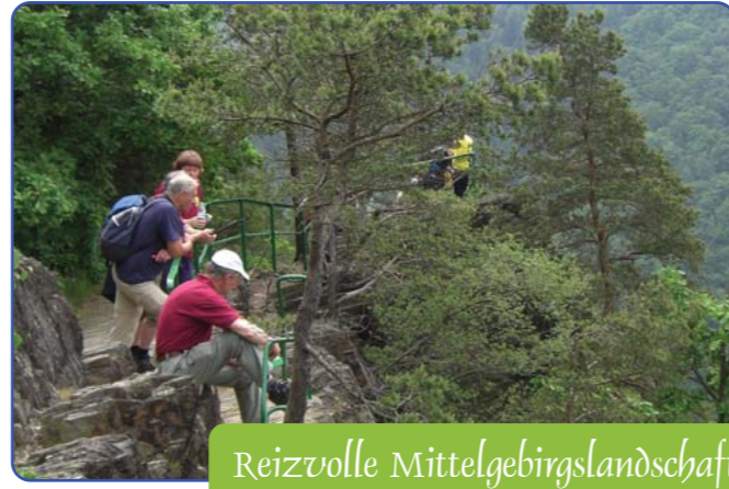
Reizvolle Mittelgebirgslandschaft erwandern

belassenen bzw. Natur nahen Wegen. Asphalt und Beton wurden, wo möglich, vermieden. Schon 1838 schwärmte der Reisende Ludwig Bechstein „Es gibt Landschaften, die man mit einem Blick festzaubern möchte in den Spiegel unvergänglicher Erinnerung, bei deren Anblick man weder in Nähe noch Ferne auch das mindeste vermisst.“ Auch der Wanderer, ob sportlich aktiv oder Landschaft und Natur genießend, beschaulich unterwegs, wird nichts vermissen. „Wer vieles bringt, wird manchem etwas bringen“. Landschaft, Natur, Kultur und die Gastgeber der Region bieten dem Wanderer viel Erlebnenswertes. Zu jeder Jahreszeit hat der Weg ein anderes Gesicht und es lässt sich kaum sagen, wann es am schönsten ist.